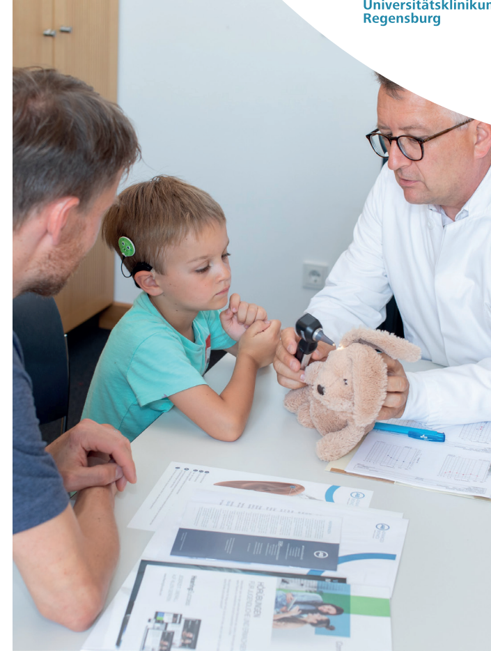
Klinik und Poliklinik für Hals-Nasen-Ohren-Heilkunde Cochlea-Implant-Centrum Ostbayern